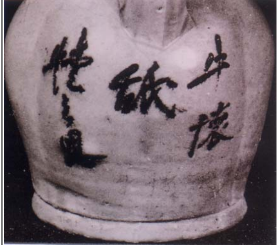
圖 14 「牛懷舐犢之恩」格言題記 長沙窯釉下彩壺