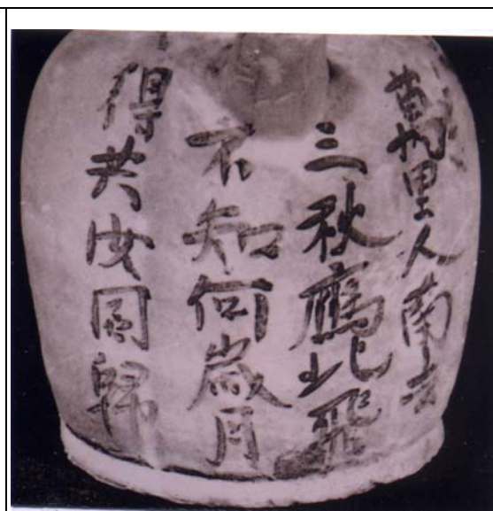
圖 3 「萬里人南去」詩題記長沙窯釉下彩壺 圖片出處：《長沙窯》圖版 185