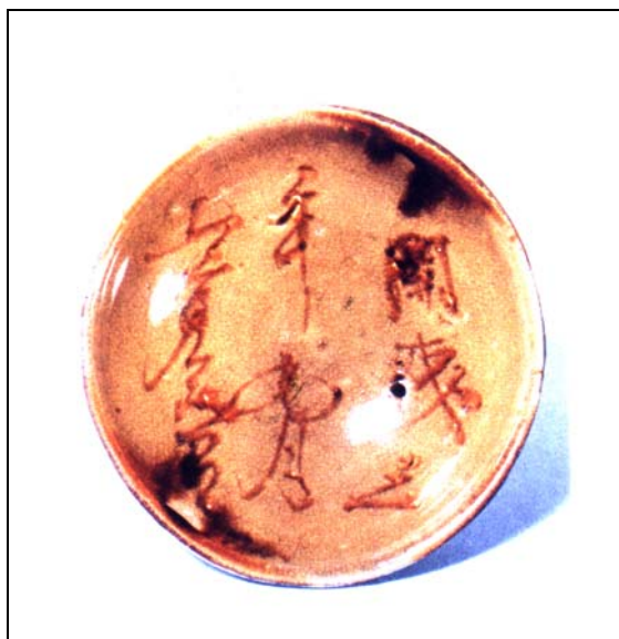
圖 1 「開成三年九月□□□」銘題記長沙窯釉下彩盤