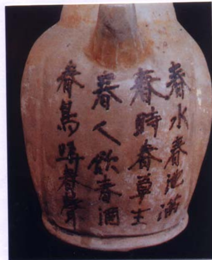
圖 8 「春水春池滿」詩題記 長沙窯釉下彩壺