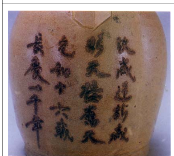
圖 2 「故歲迎新歲」詩題記長沙窯釉下彩壺 圖片出處：《長沙窯珍品新考》頁 159 圖 175