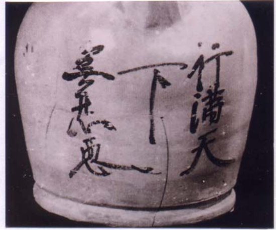
圖 11 「行滿天下無怨惡」格言題記 長沙窯釉下彩壺 圖片出處：《長沙窯》圖版 220