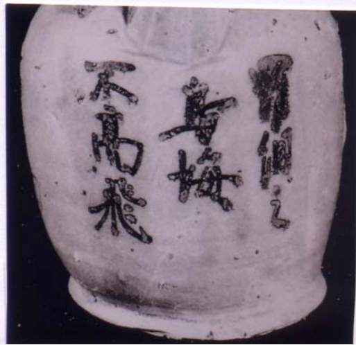
圖 15 「羅網之鳥悔不高飛」格言題記 長沙窯釉下彩壺