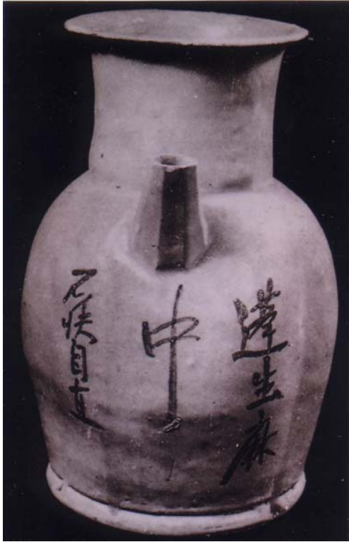
圖 13 「蓬生麻中不扶自直」格言題記 長沙窯釉下彩壺