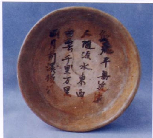
圖 6 「鳥飛平無(燕)遠近」詩題記 長沙窯釉下彩盤 圖片出處：《金石瓷幣考古論叢》 頁 129 圖 7