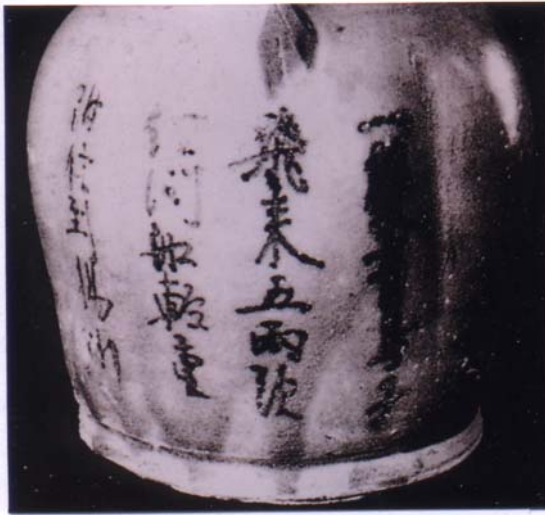
圖 9 「一雙青鳥子」詩題記 長沙窯釉下彩壺