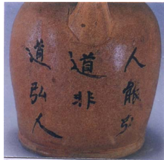
圖 12 「人能弘道非道弘人」格言題記 長沙窯釉下彩壺 圖片出處：《長沙窯珍品新考》 頁 163 圖 177