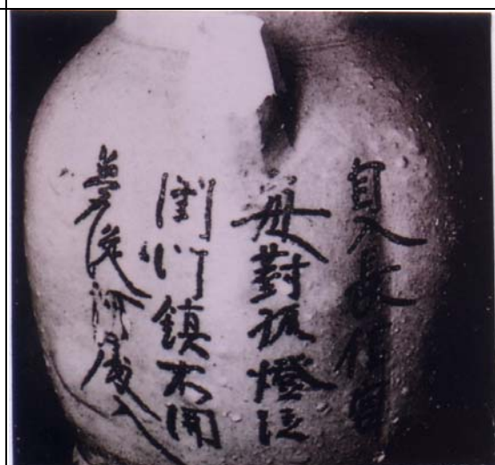
圖 4 「自入長信宮」詩題記長沙窯釉下彩壺 圖片出處：《長沙窯》圖版 199