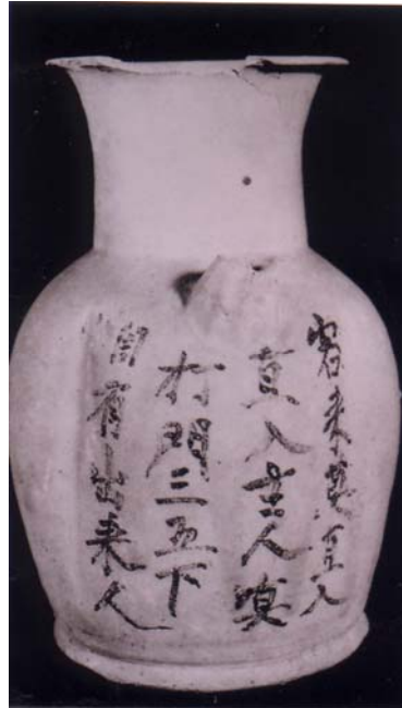
圖 7 「客來莫直入」詩題記 長沙窯釉下彩壺