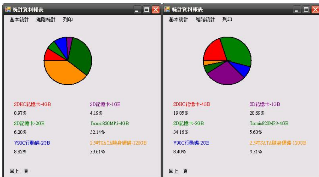
圖十二、圓餅圖依成本執行畫面 程式碼：