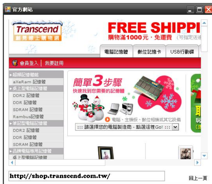
圖十五、官方網站瀏覽執行畫面