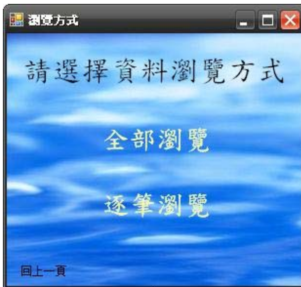
圖四、瀏覽方式選單執行畫面