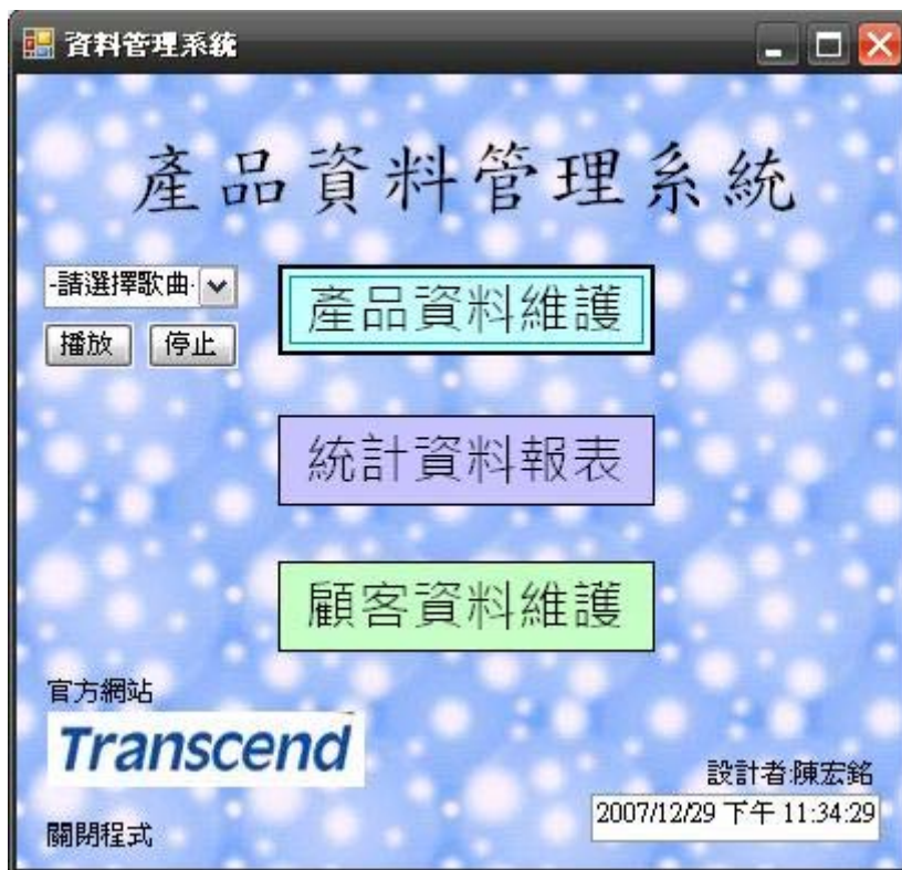
圖二、主程式執行畫面