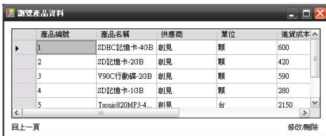
圖五、瀏覽產品資料執行畫面