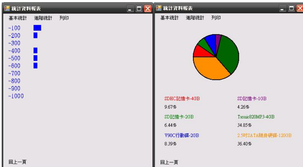
圖十、次數表依庫存量執行畫面