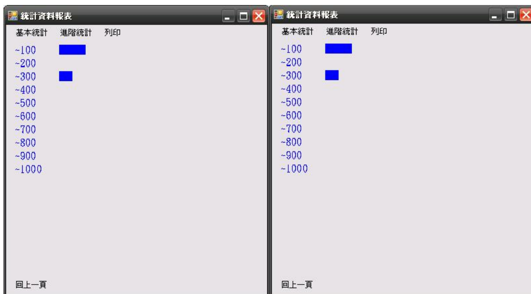
圖八、次數表依售價執行畫面