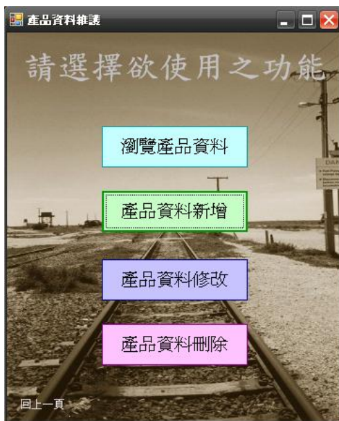
圖三、產品資料維護選單執行畫面