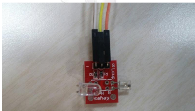
▲ 圖(三)接線圖 1-2