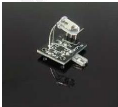
▲ 圖(一)手指測心跳模塊