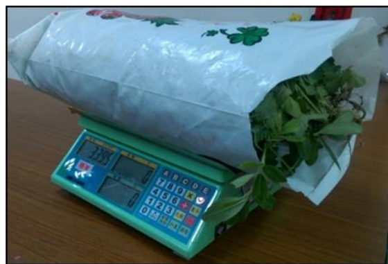
圖十七 花生秤重的照片