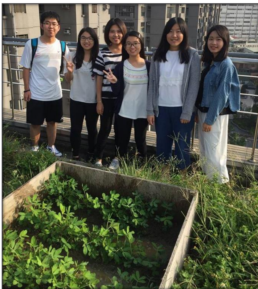
圖九 10/26 全組合照