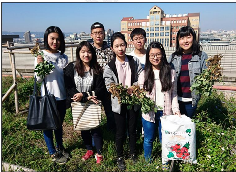
圖十九 花生收成後全體組員合影