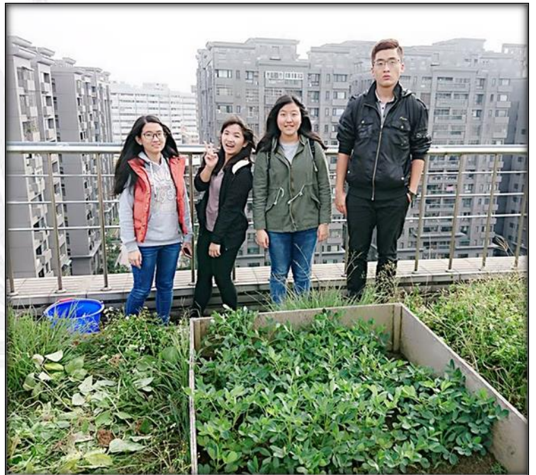
圖十四 11/30 花生及組員合影的照片