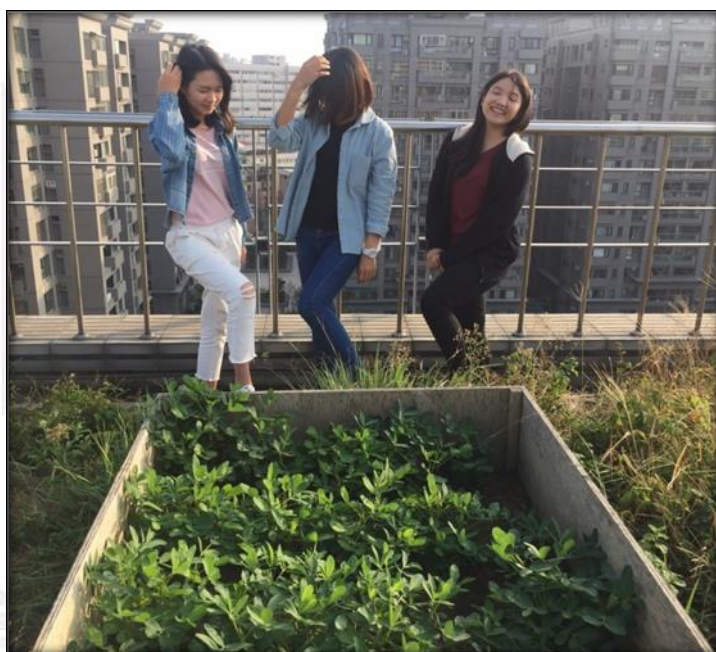
圖十三 11/16 組員及花生合影的照片