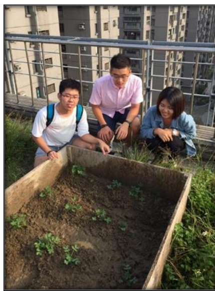
圖五 10/5 組員合影的照片