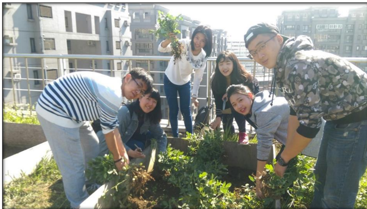
圖十六 12/19 花生收成及組員合影的照片