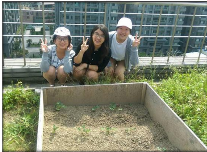
圖四 10/4 組員合影的照片