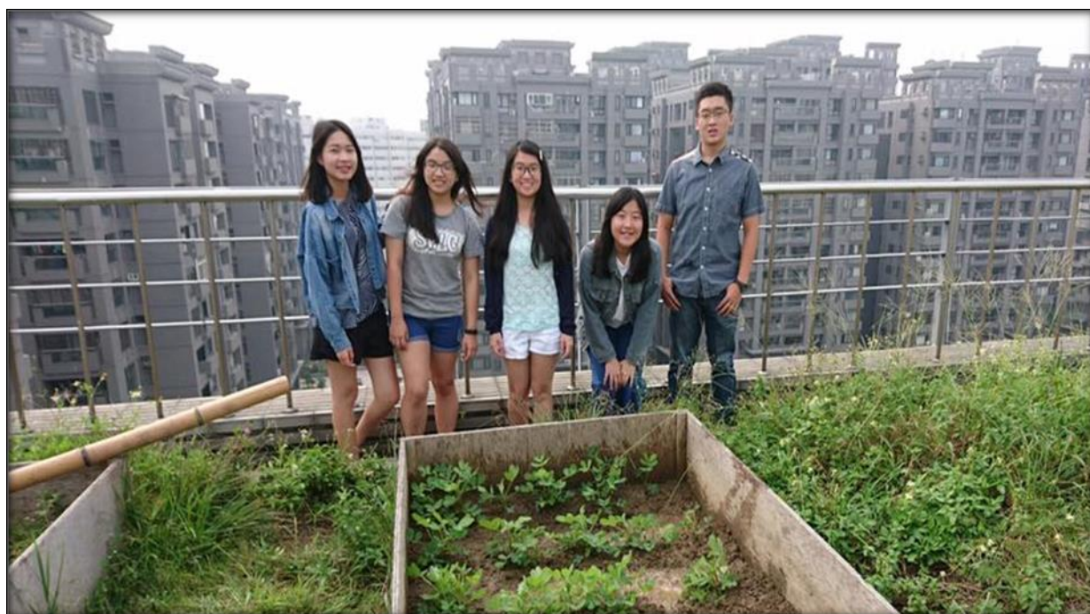
圖八 10/19 組員合影的照片