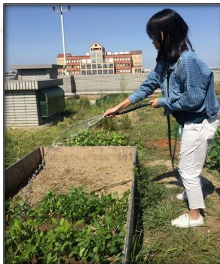
圖十一 11/02 組員辛苦照顧花生的照片