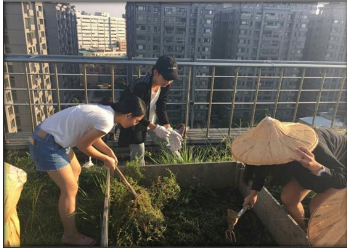
圖二 整理農地的照片