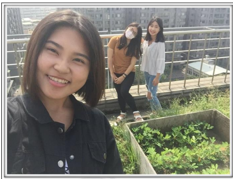
圖十 10/28 組員合影的照片