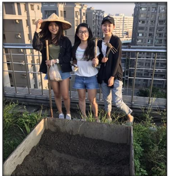
圖三 整理農地後的組員大合照