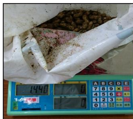
圖十八 花生秤重的照片