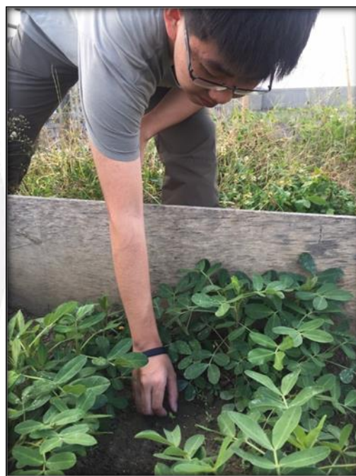
圖十二 11/11 花生成長的照片