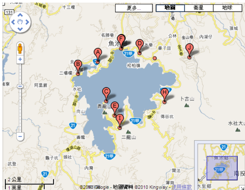
停車場分佈圖：圖中 A 到 J 為停車場