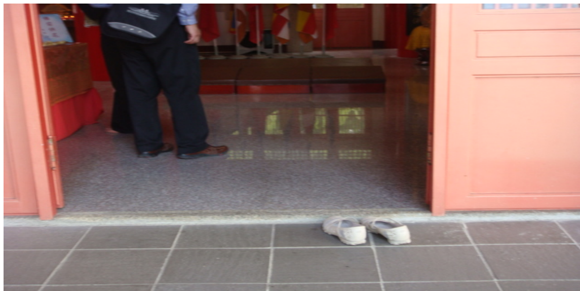
有人未拖鞋則進入