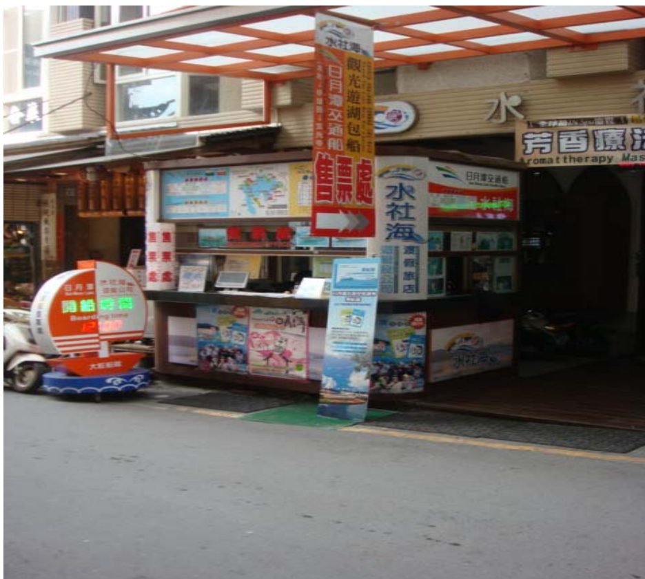
遊船售票處人數甚少

景外，也希望可以一品當地的特色飲食，所以日月潭的規劃不妨可以從此點加強，發展當地飲食文化，打造具有當地特色的品牌飲食，這樣既可以增加當地民眾的收入，發展地方經濟，還能為日月潭的遊憩特色錦上添花。