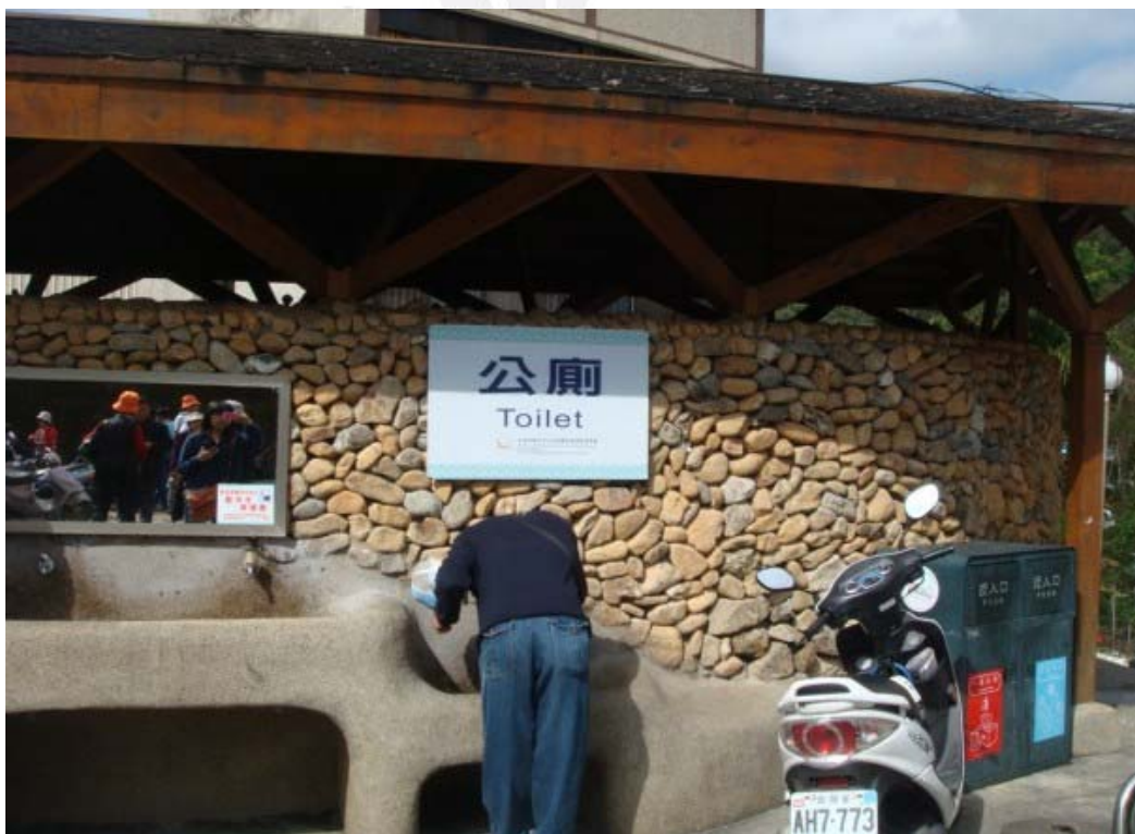
日月潭公廁外觀圖：外觀具一定特色，但衛生環境有待改善

(5) 日月潭風景區的公共設施維護問題：面對目前遊客量大增的情況，日月潭風景區的公共設施維護顯得尤為重要，例如公共洗手間的維護。我們在實地調查過程中發現，日月潭風景區的洗手間衛生環境還有待改善，雖然我們不能改變使用者本身，但是有關部門的一些作為還是很重要的。就公共洗手間而言，除了定期派人維護環境外，還可以通過在洗手間貼上人性化方式的提示，來盡力改善衛生環境。