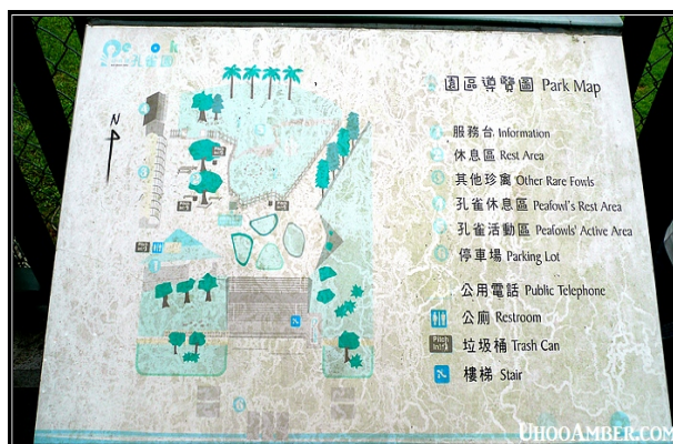
日月潭孔雀園導覽圖