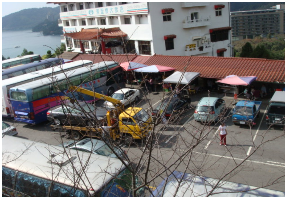
文武廟前的停車場