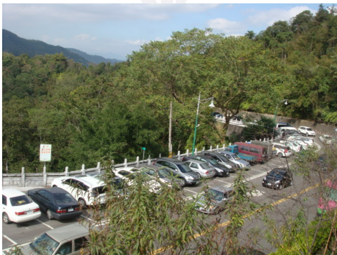
許多車輛停到了路旁